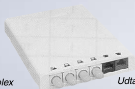
Udtagsboks 6 port