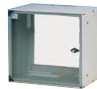
Minirack med glas